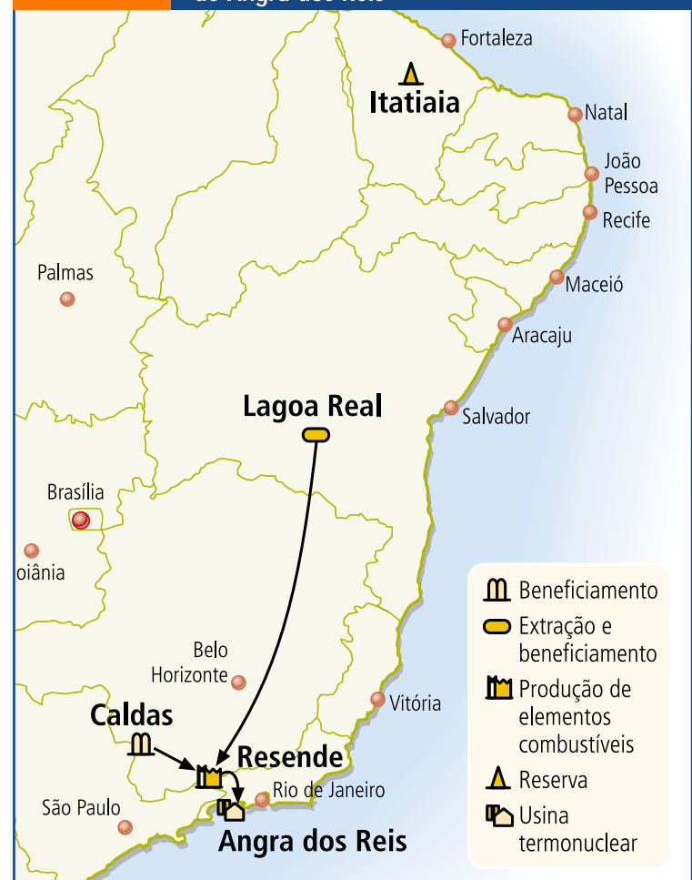
FIGURA 10.3 Reservas nacionais de urânio, unidades de extração, beneficiamento e produção de elementos combustíveis e usina termonuclear de Angra dos Reis