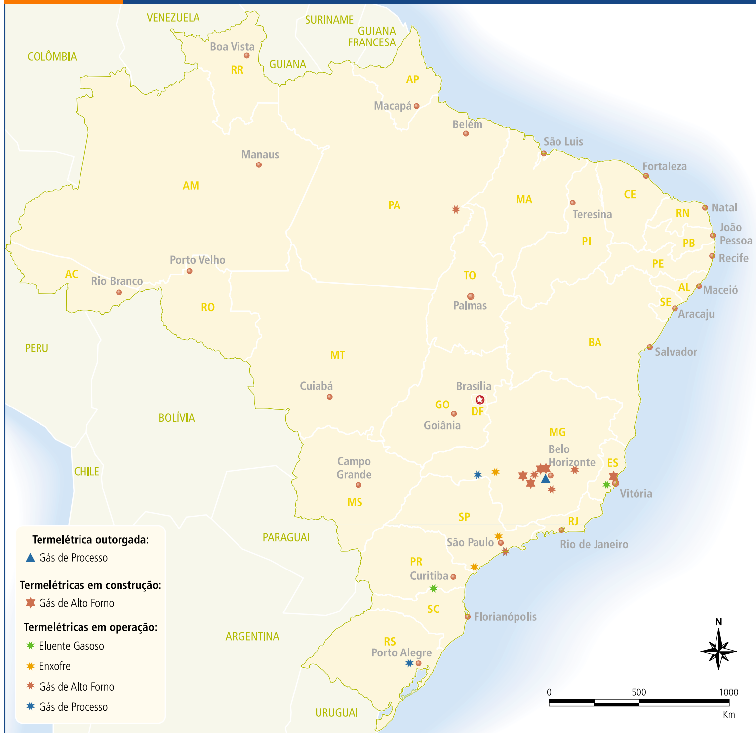
FIGURA 10.4 Termelétricas atuais e futuras (efluente gasoso, enxofre, gás de alto forno e gás de processo) - situação em setembro de 2003